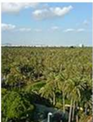
Gaj palmowy w Elx