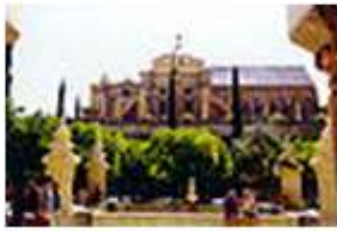
Zespół zabytkowy w Kordobie □