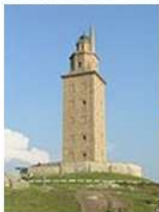
Wieża Herkulesa ⊠