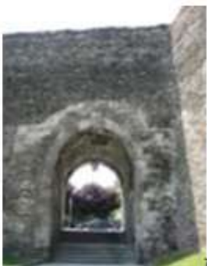
Rzymskie mury obronne w Lugo