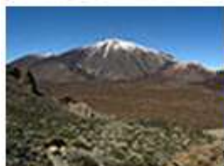
Park Narodowy Teide na Wyspach Kanaryjskich ⊠