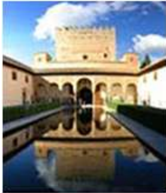
Alhambra , ogrody Generalife , twierdza Albaicín w Grenadzie □