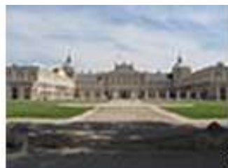
Krajobraz kulturowy Aranjuezu ⊠