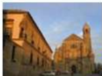
Renesansowe zespoły zabytkowe Úbeda i Baeza ⊠