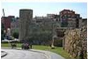
Zespół archeologiczny Tarraco