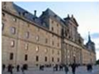
Klasztor i pałac Escorial pod Madrytem □