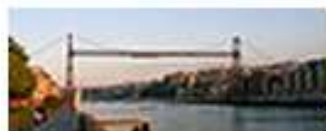
Most Biskajski ⊠