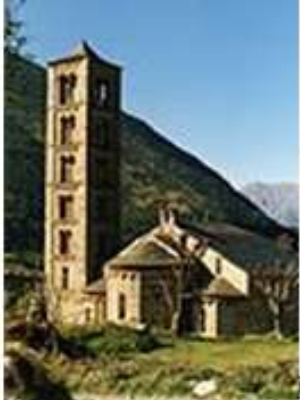
Zespół katalońskich kościołów romańskich w Vall de Boí