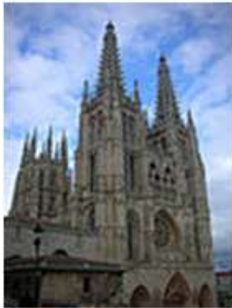
Katedra w Burgos □